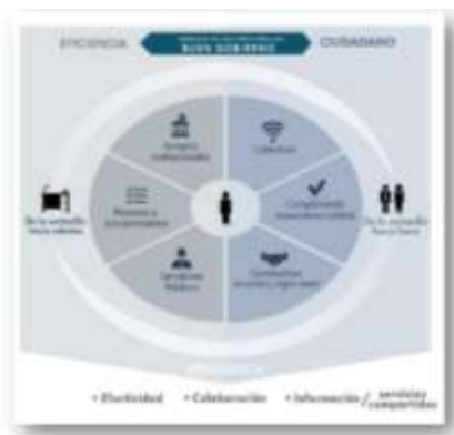
Ilustración 2. Modelo de Gestión Públicas Buen Gobierno